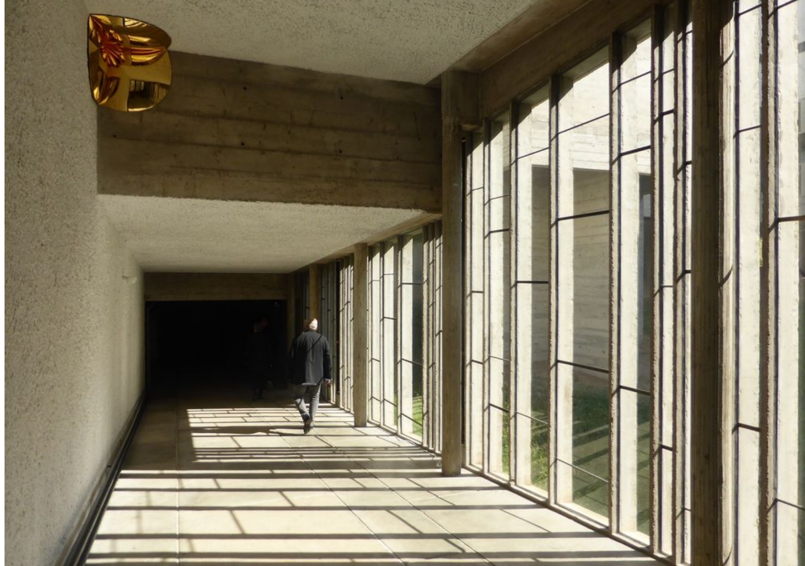
Anish Kapoor, 220 Aluminium Mirror, 2011, aluminium, 70 x 234 x 234 cm. & Gold Corner, 2014, fibre de verre et or, 63,5 x 63,5 x 63,5 cm. Exposition Anish Kapoor chez Le Corbusier, couvent de La Tourette © Le Curieux des arts Gilles Kraemer, présentation presse, 9 septembre 2015

En une silencieuse conversation, ses œuvres interagissent avec l'architecture de béton, si pure et totalement inspirée : l'artiste s'imprégnant de cet endroit y dépose des pièces en symbiose avec ce lieu. Comme le souligne Frère Marc Chauveau, " la réceptivité, l'écoute et l'humilité face au bâtiment se doivent d'exister ", des points cruciaux de cette mise en dialogue.