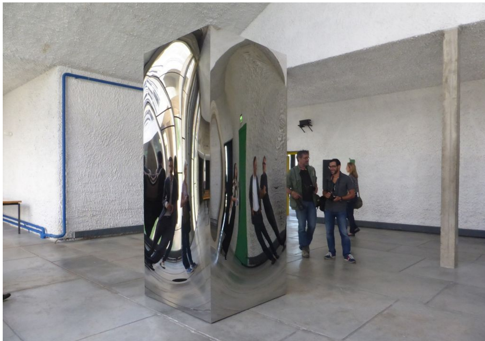
Anish Kapoor, Non-Object (Door), 2008, acier inox, 280 x 118 x 118 cm. & Sky Mirror, 2007, acier inox, diamètre 280 cm. Exposition Anish Kapoor chez Le Corbusier, couvent de La Tourette © Le Curieux des arts Gilles Kraemer, présentation presse, 9 septembre 2015

Comment ressentir cette rencontre entre Kapoor et Le Corbusier ? Regardez tout simplement. Ouvrez les yeux. Et, d'évidence, vous comprendrez comment cet artiste indien entra en résonance avec le couvent de La Tourette. Extraordinaire. Dans ce lieu de vie, que ce soit l'église, le réfectoire ( 220 Aluminium Mirror ), la salle du chapitre, les salles Lebret, Couturier ou Tito de Alencar ou dans un couloir ( Gold Corner ), elles habiteront pendant quelques temps tous ces espaces. Elles se révèlent comme nulle part ailleurs et interagissent, " allant jusqu'à renouveler le regard sur le bâtiment et sur elles-mêmes. "