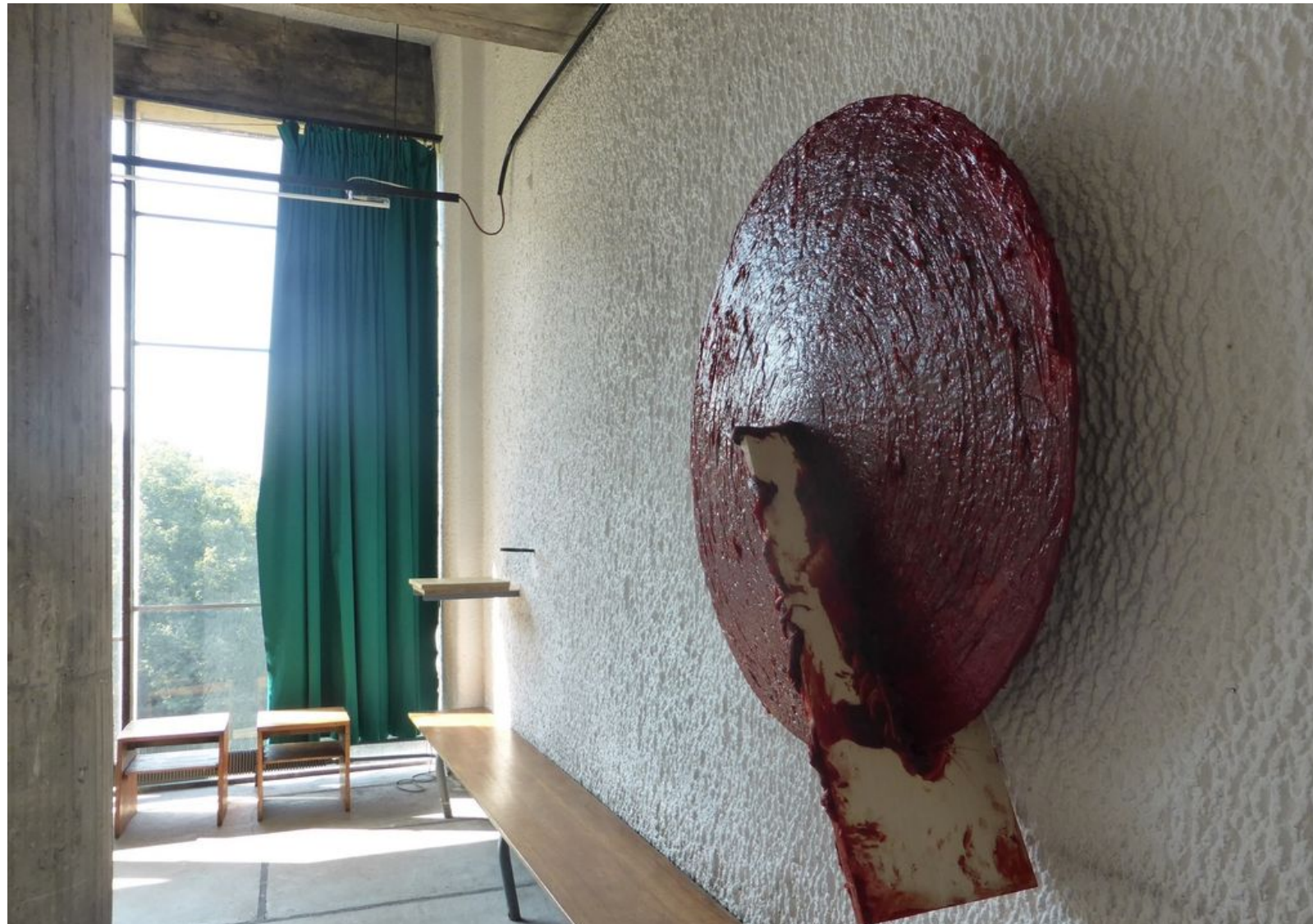
Anish Kapoor, Disrobe, 2013, silicone et pigments, 140 x 180 x 55 cm. & Untitled, 2015, cre et métal, 135 x 116 x 36 cm. Exposition Anish Kapoor chez Le Corbusier, couvent de La Tourette © Le Curieux des arts Gilles Kraemer, présentation presse, 9 septembre 2015

Face à Non-Object (Door) (2008) dans l'atrium, l'architecture se met étonnamment en mouvement lorsque l'on tourne autour de cette pièce en acier inox, placée comme au milieu d'un carrefour. Tel un écho, elle nous renvoie la déformation de notre image et de l'architecture. Tout en douceur, placée à l'extérieur, Sky mirror (2007) tourné vers le ciel reflète l'architecture et le ciel, dans ce bâtiment où s'ouvrent des perspectives sur la nature.