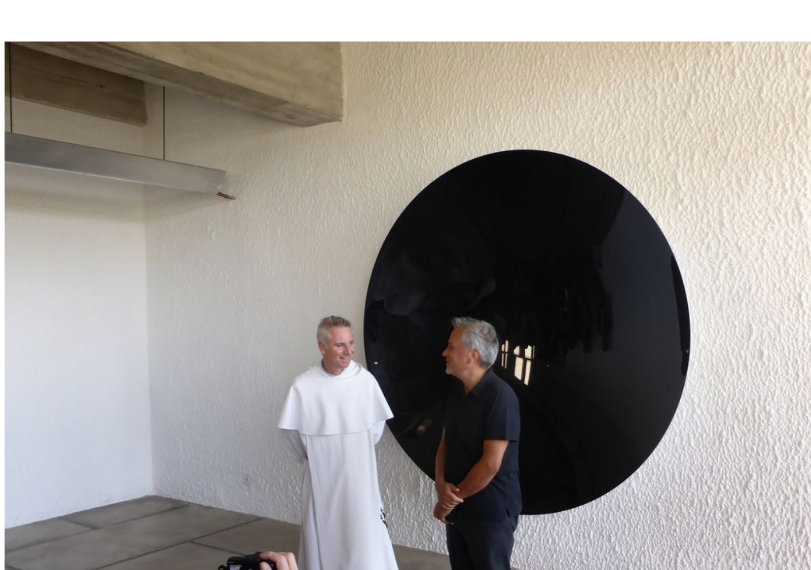
Frère Marc Chauveau et Anish Kapoor, Exposition Anish Kapoor chez Le Corbusier, couvent de La Tourette © Le Curieux des arts Gilles Kraemer, présentation presse, 9 septembre 2015