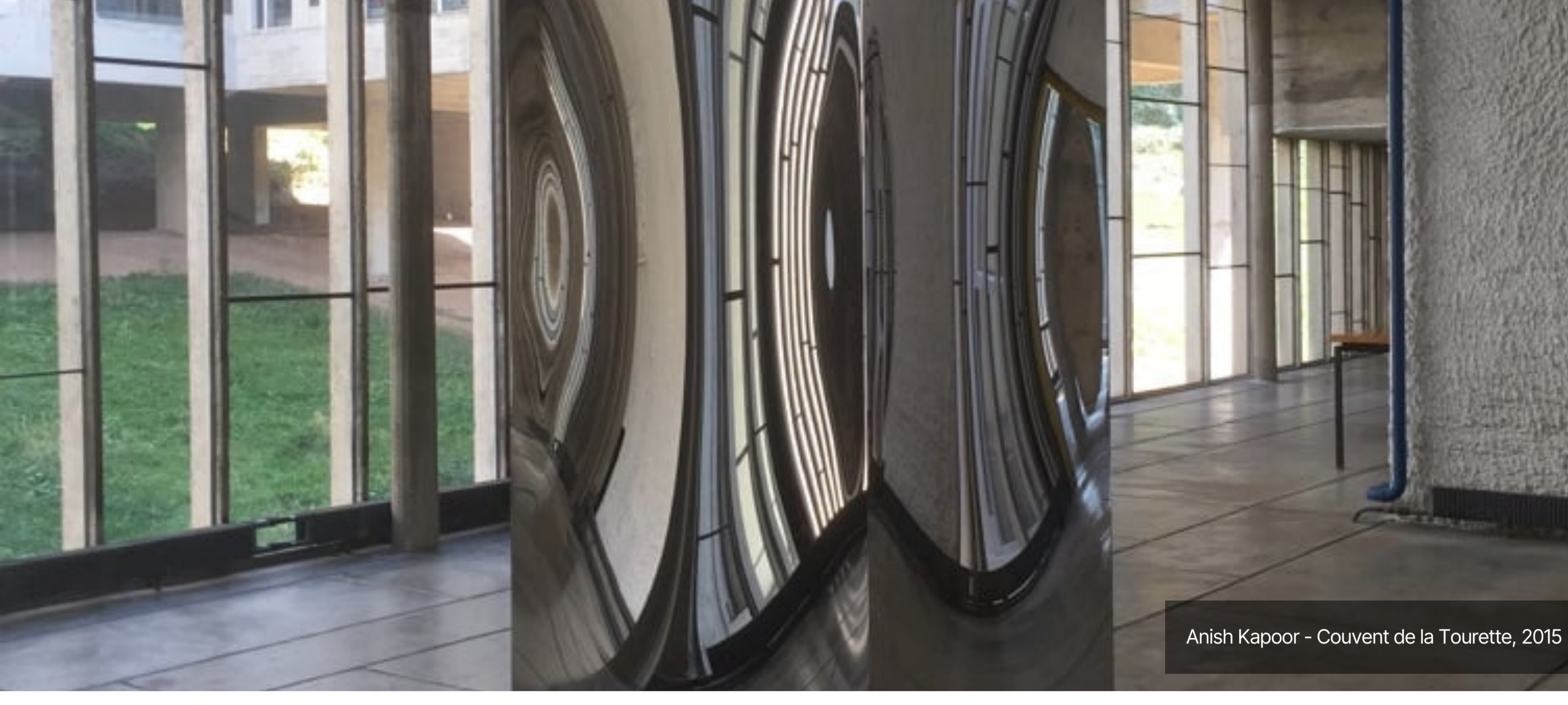
Anish Kapoor - Couvent de la Tourette, 2015

TAG ANISH KAPOOR BIENNALE DI LIONE CONVENTO DELLA TOURETTE ÈVEUX